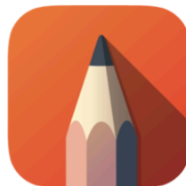
Auto Sketch Book