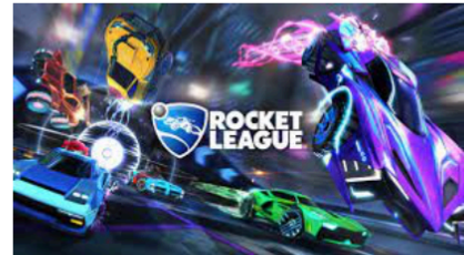
Ab 8 J. „Auto-Fussball“ (Konsole)