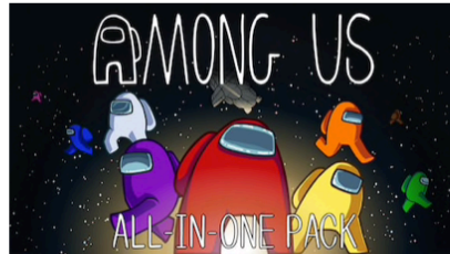
Ab 6 J. (Tablet, Smartphone, Switch)