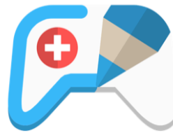
Draw your Game