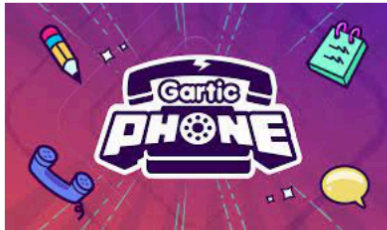
Ab 6 J. „Stille Post“ (Browser)